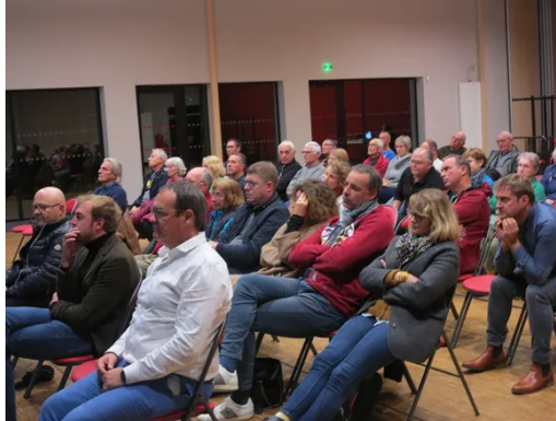
La municipalité a organisé une réunion publique pour faire un point d'étape après cinq ateliers citoyens.