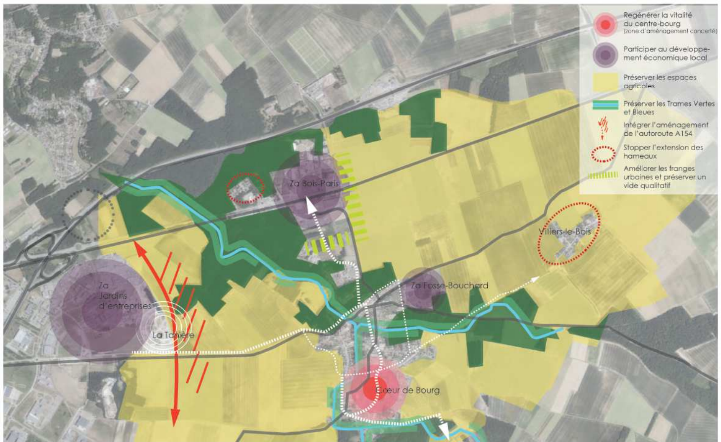
Plan du PADD du projet de PLU révisé de la commune de Nogent-le-Phaye